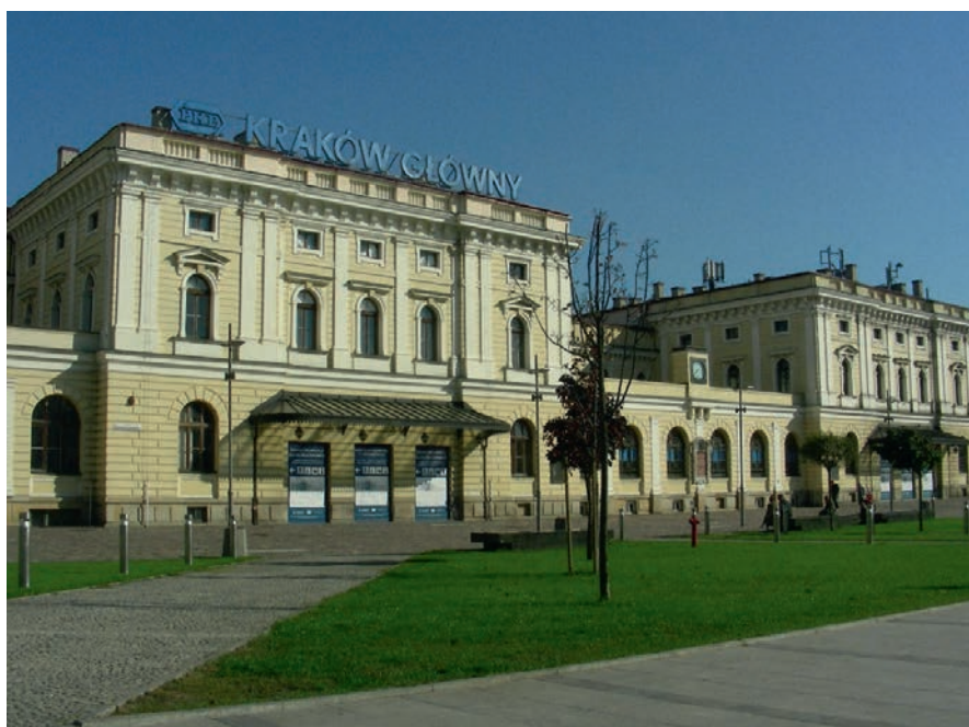
Fot. 2. Budynek dawnego dworca kolejowego Kraków Główny