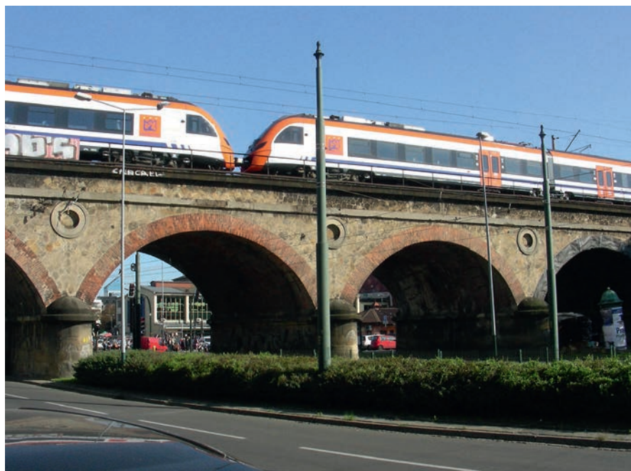
Fot. 3. Kraków – wiadukt kolejowy przy ul. Grzegórzeckiej, dawny most nad starym korytem Wisły