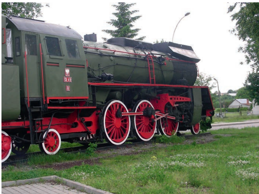
Fot. 5. Przeworsk – zabytkowa lokomotywa kolejki wąskotorowej „Pogórzanin”