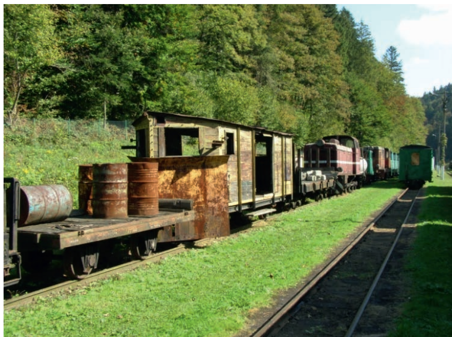
Fot. 4. Stary tabor kolejki wąskotorowej w Majdanie