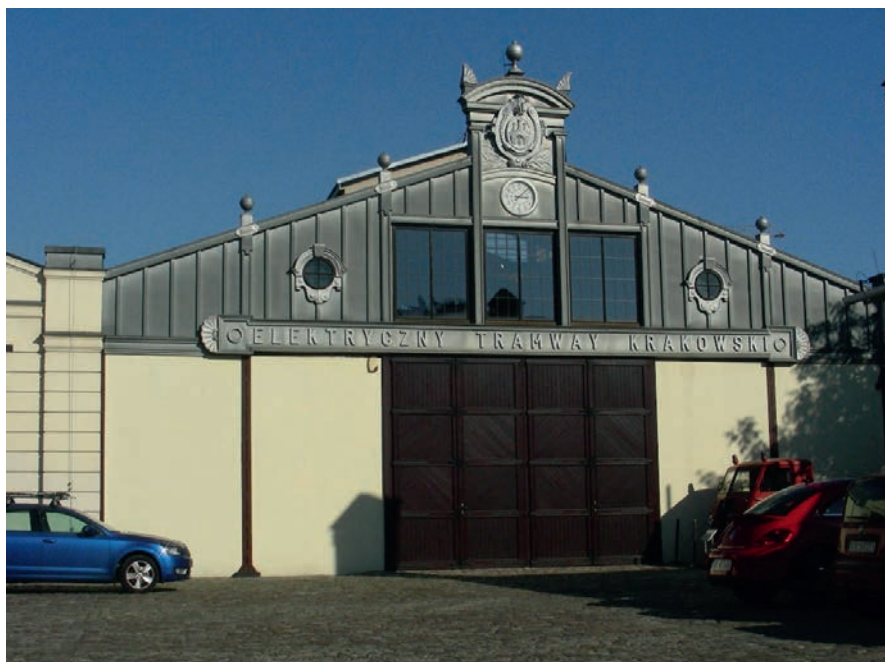
Fot. 1. Dawna zajezdnia tramwajowa, obecnie obiekt Krakowskiego Muzeum Inżynierii Miejskiej